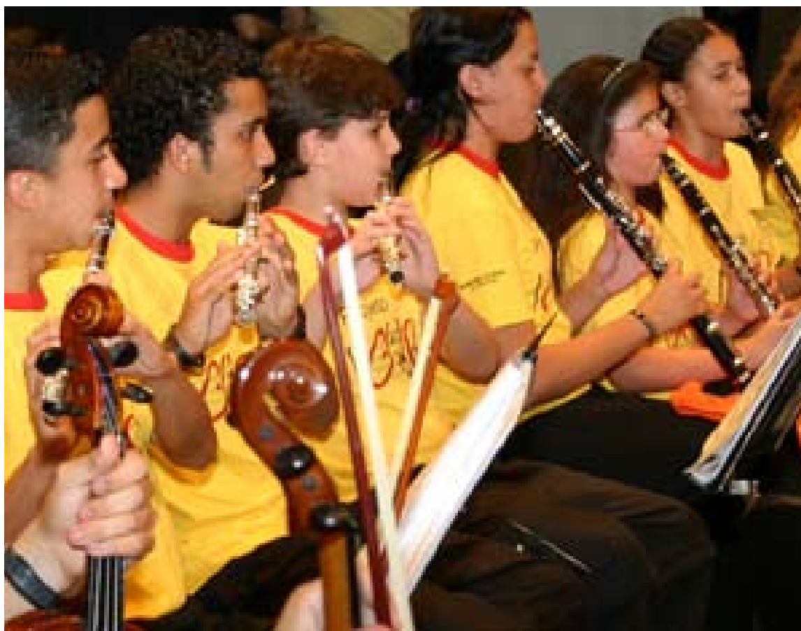
Santo André, Brasile. Progetto "Guri"

Sempre nella città di Santo André , Pirelli supporta "Cata Preta" , l'asilo di periferia che accoglie 80 bambini poveri della zona, dai 2 ai 6 anni, con attività di educazione all'infanzia e assistenza pediatrica.